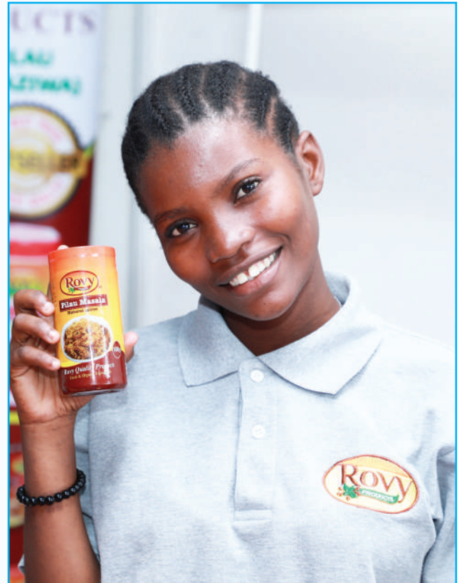
Mjasiriamali akionesha Alama ya Biashara ya bidhaa yake.

Jitihada hizi zinazofanywa na Wakala ni kuhakikisha kwa biashara ndogo na za kati zinalelewa na kufika pale zilipokusudiwa.