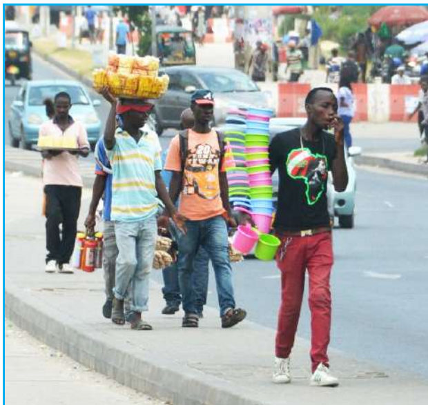
Wajasiriamali wakiwa katika harakati za kuuza bidhaa zao.

kuambatisha nyaraka ambazo ni Katiba ya Kampuni, Fomu ya uadilifu, Fomu ya majumuisho (Consolidated Form).