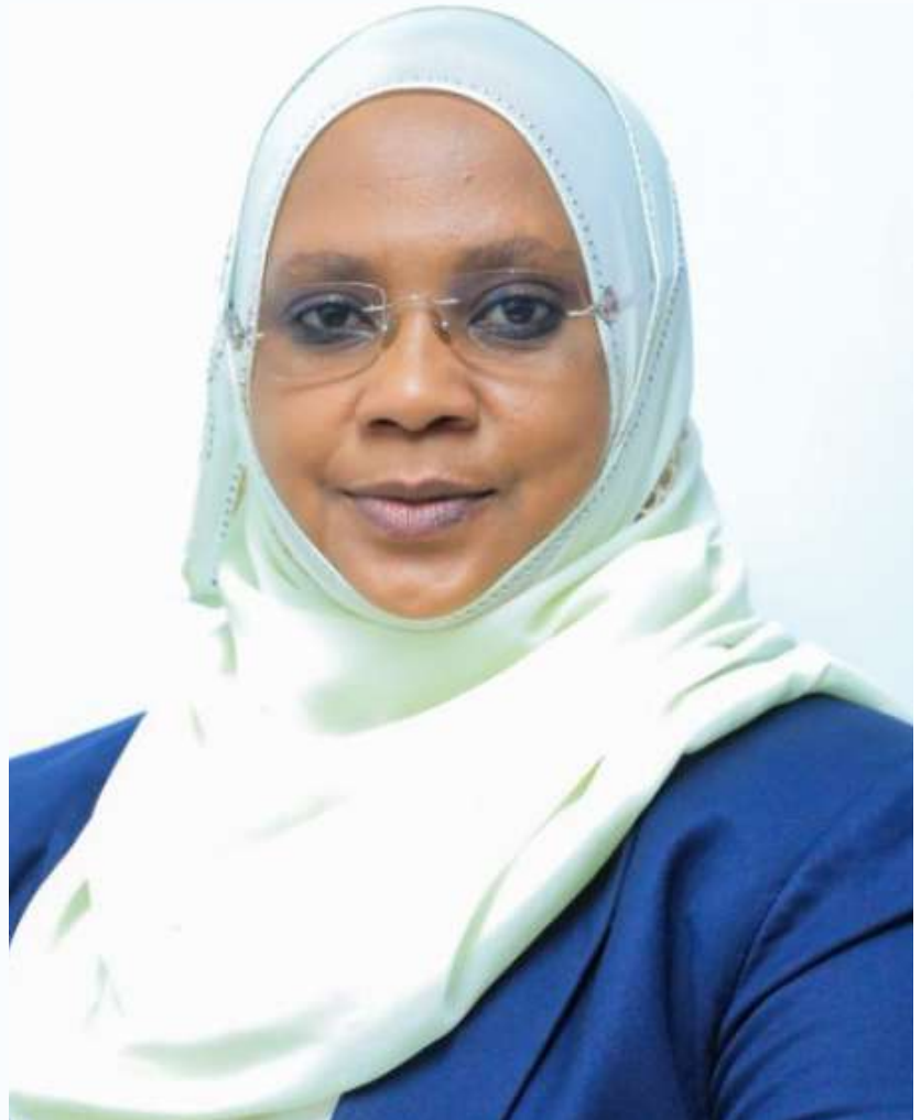
Dkt. Ashatu Kijaji (Mb)