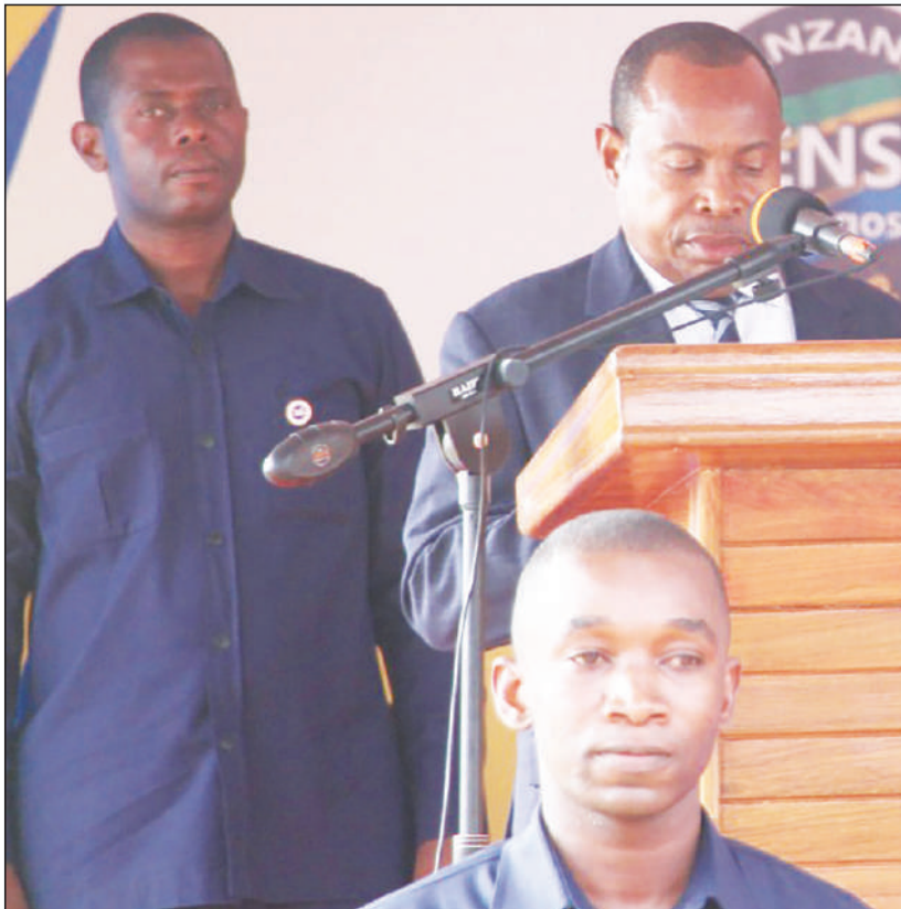
Makamu wa kwanza wa Rais wa Zanzibar Mhe. Othman Masoud Othman akifungua Maonesho ya Wiki ya Ubunifu katika Uwanja wa Jamhuri jijini Dodoma.

BRELA imekuwa ikitoa elimu ya namna ya kuboresha bunifu zile ambazo zimesajiliwa na kuziendeleza na kuangalia jinsi ya kushirikiana na taasisi nyingine za kikanda na kimataifa kuwasaidia kuzipatia masoko.